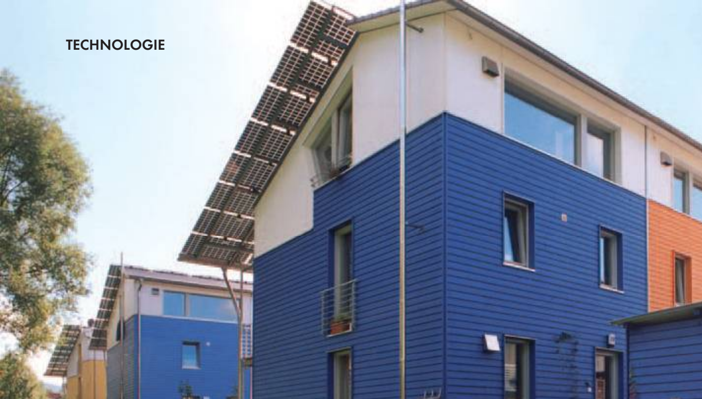
▲ Die Energiewende beginnt zu Hause: Reihenhäuser mit Solaranlagen